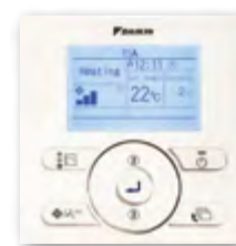
BRC073 en option.